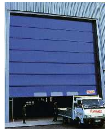
LASER può chiudere ogni tipo di varco