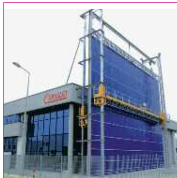
Lunghezza da 20 a 40 m - H da 10 a 20 m

Conformità alle direttive sulla sicurezza