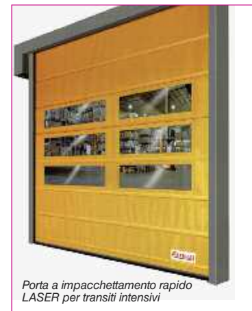
Porta a impacchettamento rapido LASER per transiti intensivi