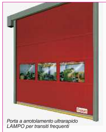
Porta a arrotolamento ultrarapido LAMPO per transiti frequenti