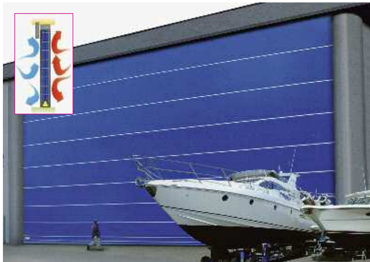
Portoni a impacchettamento a doppio pannello GIANT DOOR