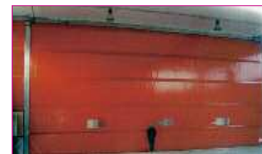
LASER è indicata per transiti rapidi e frequenti

Grazie alla sua velocità di apertura e chiusura e alle sue qualità di alto isolamento termico, robustezza e sicurezza, LASER è la soluzione ideale per flussi di transito rapidi e continui. Dotata di struttura in lamiera zincata a caldo o in acciaio inox e di pannelli in poliesteri autoestinguenti potenziati con tubolari rigidi di rinforzo, offre una resistenza di 80/90 km/h alle pressioni del vento e assicura un utilizzo intensivo senza costi di manutenzione. LASER può chiudere ogni tipo di varco, anche di 20 metri di larghezza per 15 di altezza, e può essere realizzata e installata su misura in funzione delle dimensioni dei varchi e dell'eventuale presenza di travi, tubi o condotti. I pannelli, disponibili in tutti i colori standard, sono personalizzabili con serigrafie: possono essere dotati di finestrature in PVC trasparente Cristal. LASER è rispondente alle norme CE, ed è dotata di tutti i dispositivi di sicurezza, quali il sistema di blocco e risalita del pannello antischiacciamento in caso di ostacolo e l'apertura di emergenza in caso di mancanza di corrente elettrica.