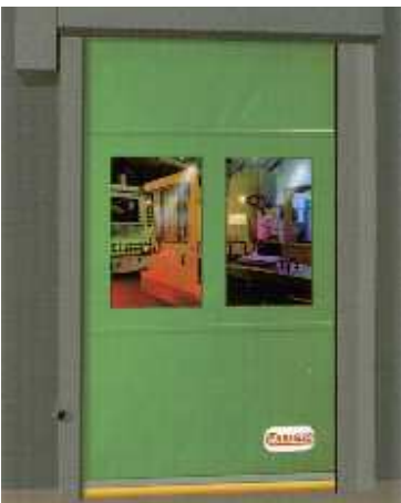
La porta LAMPO può essere ubicata ovunque

Dotata di un sistema di scorrimento del pannello rapidissimo, con il telo che si arrotola direttamente sull'albero senza dispositivi di trascinalamento, la porta LAMPO è concepita per le esigenze della