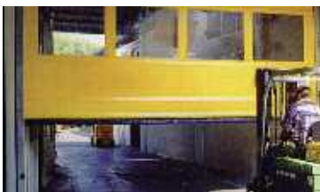
Maggiore razionalità nel transito