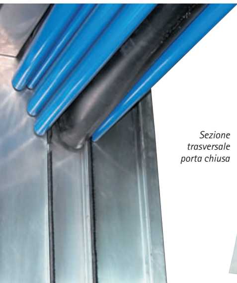
Sezione trasversale porta chiusa